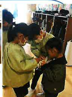
玄関からクラスまで連れてきて準備のお手伝いをしてくれました