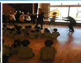
先生方の劇で先生の名前を覚えました