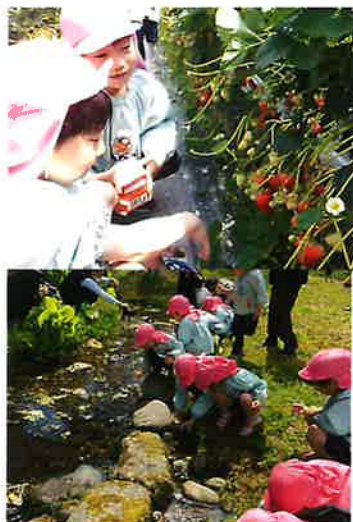
子ども達のたくさん の発見が 好奇心につなが りました！