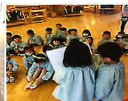
お約束を紙芝居にしました