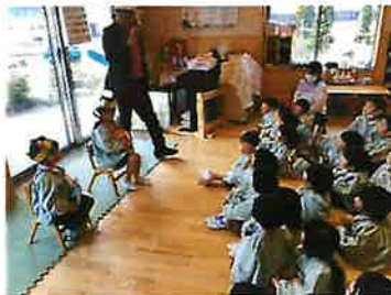
年少さんは、初めてのインタビューに恥ずかしそうに答えてくれました。