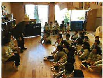
年長さんは、自分たちで誕生会を進めました！プレゼントも作りみんなでお祝いしました！