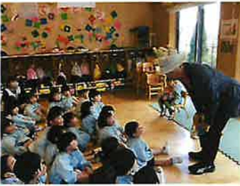
園長先生から、めだかの話の絵本のプレゼント☆みんな大笑いでした！