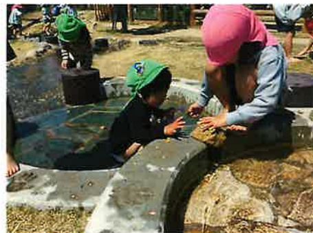
5歳児と 1歳児の 関わり

このような幼少期の充実した学びをもって小学校に進み、学習を狭い意味でとらえるのではなく、生活の中で社会全体の事象や興味などと広く結び付けながら学んでほしいと願います。