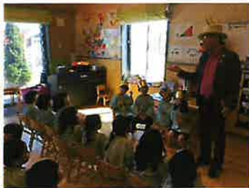
年中さんは、園長先生のお話に元気に答え、にぎやかな誕生会でした☆