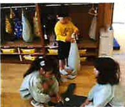
お着替えのお手伝いをしてくれました